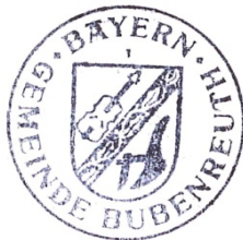
Norbert Stumpf Erster Bürgermeister