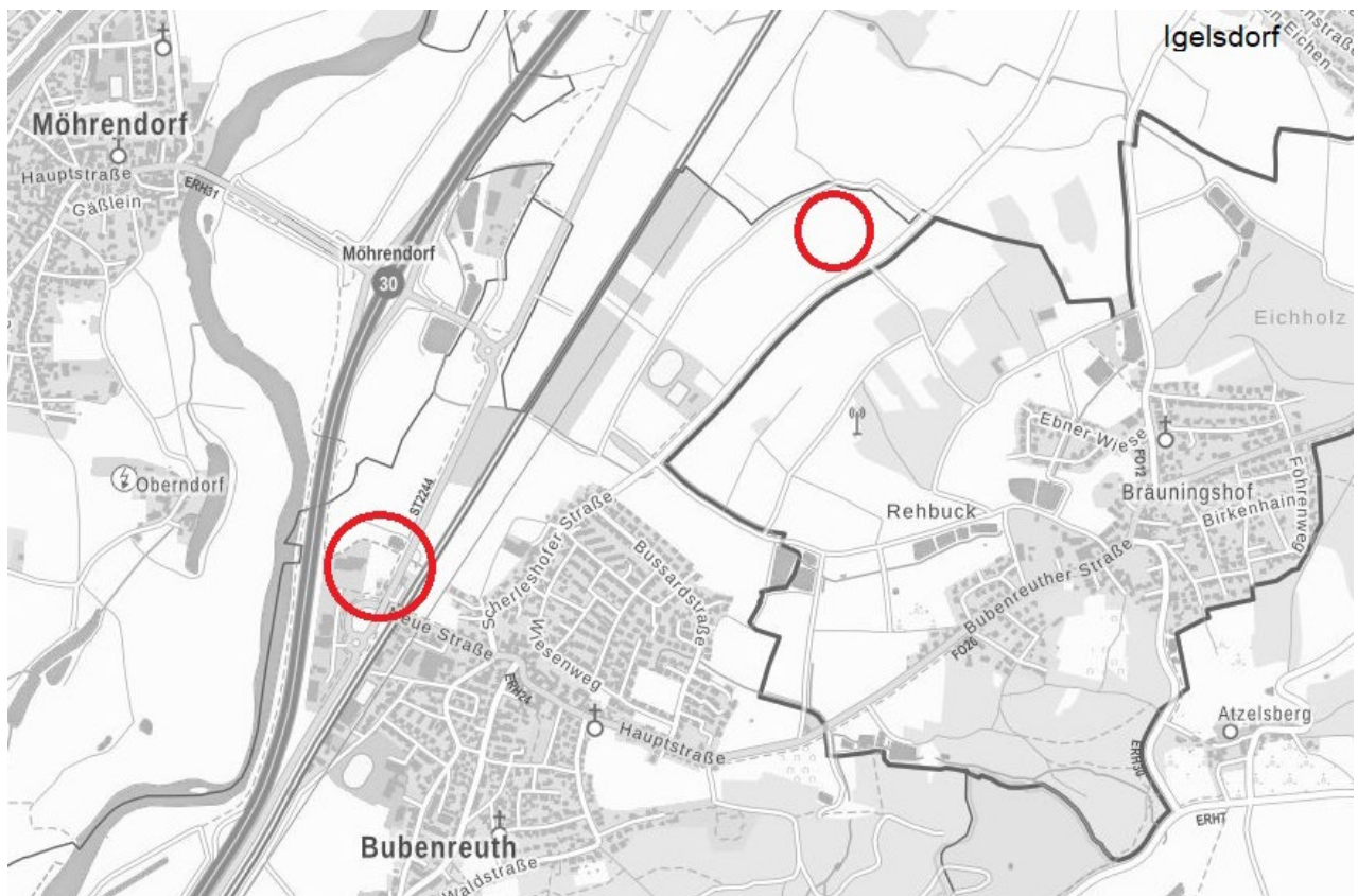
Übersichtslageplan mit Baugebiet (großer Kreis) und externer Ausgleichsfläche (kleiner Kreis)

Zugeordnet wird eine externe Ausgleichsfläche westlich der Gemeindeverbindungsstraße nach Igelsdorf (siehe nachfolgenden Übersichtslageplan, kleiner Kreis).