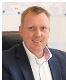
Norbert Stumpf Erster Bürgermeister