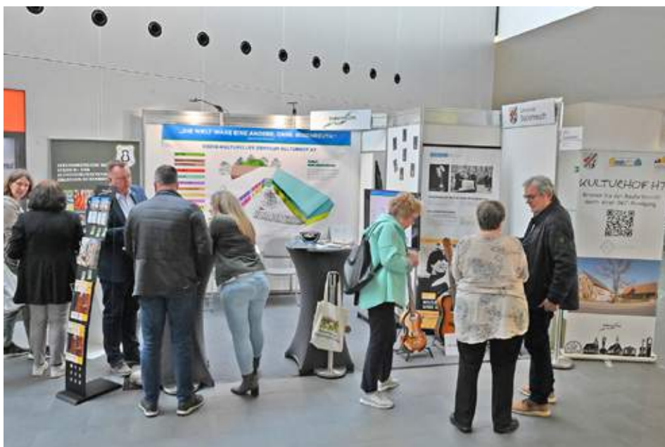
Der Messestand der Gemeinde Bubenreuth und des Vereins Bubenreutheum e.V. im Foyer zwischen Musik-Messe und Freizeit-Messe fand viel Beachtung.