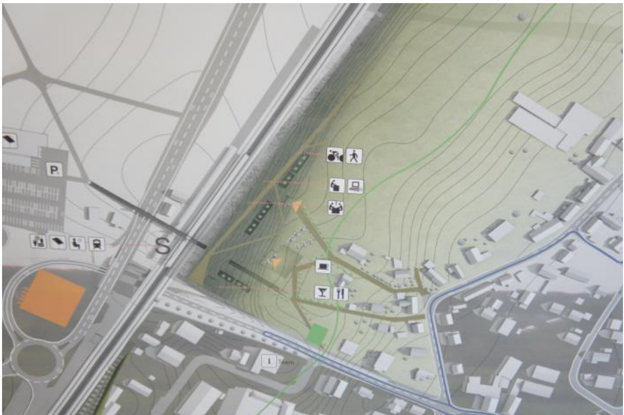
Mediencampus - Lageplan©