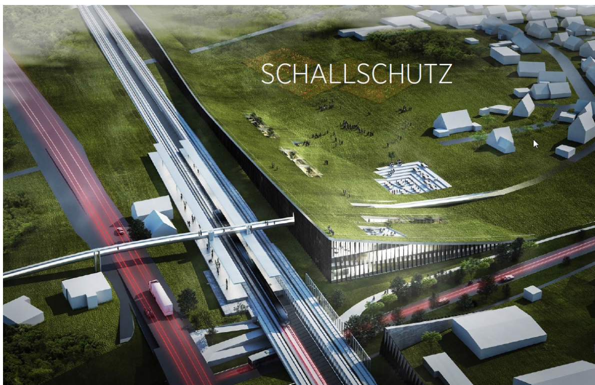
Mediencampus Ansicht von Süd-West©

Dieser Entwurf begeisterte die Bürgerinnen und Bürger am meisten. Als besonders gelungen wurde der in die Natur integrierte Schallschutz anerkannt, ebenso der Gedanke an eine Verkehrsführung außerhalb dieses Quartiers und die Variabilität der baulichen Ausgestaltung.